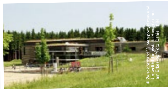
Das Hunsrückhaus am Erbeskopf